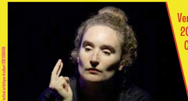
Festival artistique étudiant ESCOMMOR

Vendredi 21 avril 2023 20h30 - Salle des Fêtes Constans