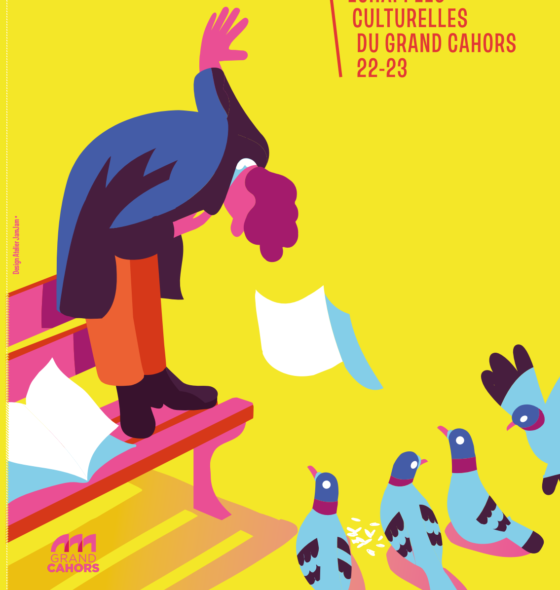
Design Kébir JamJam

ÉCHAPPÉES CULTURELLES DU GRAND CAHORS 22-23