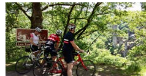
Cyclotourisme aux Tours de Merle