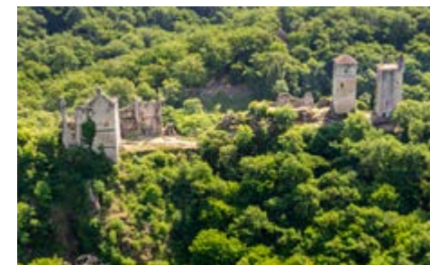
Tours de Merle