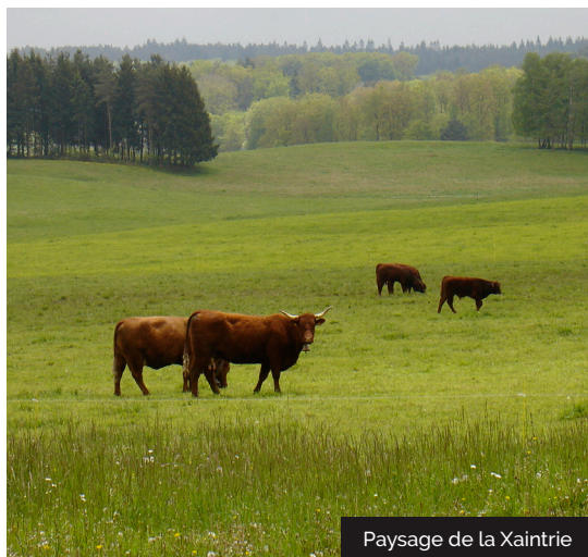
Paysage de la Xaintrie

Embarquez vos randonnées en téléchargeant l'appli Vallée de la Dordogne - Tour sur iPhone, l'iPad et l'iPod touch