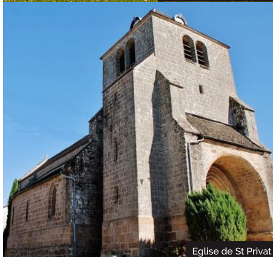
Eglise de St Privat