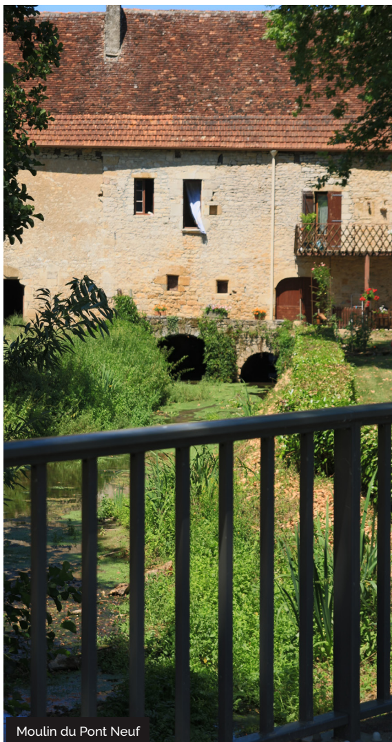
Moulin du Pont Neuf

Le château de Blanat n'est visible que de l'extérieur, il domine le confluent de la Dordogne et de la Tourmente. Sa belle situation à l'extrémité d'un plateau permettait de dominer, et donc surveiller la plaine. Il offre un beau point de vue.