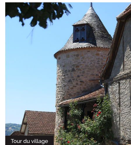
Tour du village

6 Environ 100m après la maison récente à gauche, descendre le chemin à droite, puis prendre à gauche au croisement pour rejoindre la D803. Traverser-la (attention), et la suivre à gauche sur 20m. Virer à droite et sitôt à gauche à la patte d'oie. La route mène au château de Blanat , à 900m de là. Sur la propriété, respecter le balisage et les lieux. Point de vue . Descendre dans les bois, prendre la route à droite qui ramène vers le cimetière, puis à nouveau à droite vers le bourg (départ).