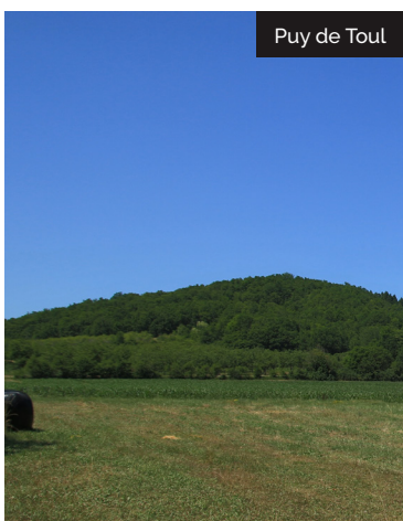
Puy de Toul