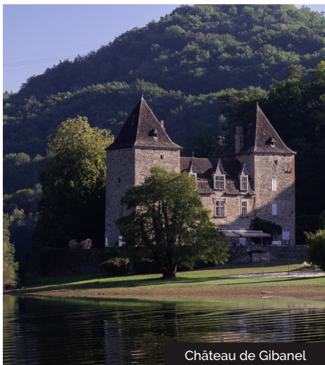
Château de Gibanel

3 Quitter le chemin pour suivre un sentier à droite qui monte en épingle. Vue depuis le Roc Castel sur : les gorges à gauche et, à droite, la vallée de la Dordogne, Argentat, le barrage du Sablier et le Puy du Tour. Faire demi-tour sur 100m, puis emprunter le 1 er sentier à droite, le long d'un mur de pierres sèches. Suivre la route qui revient au bourg.