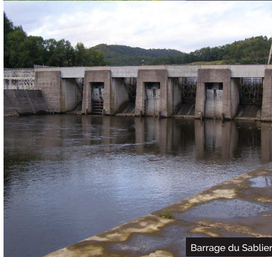
Barrage du Sablier