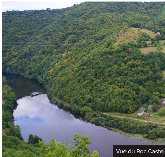
Vue du Roc Castel