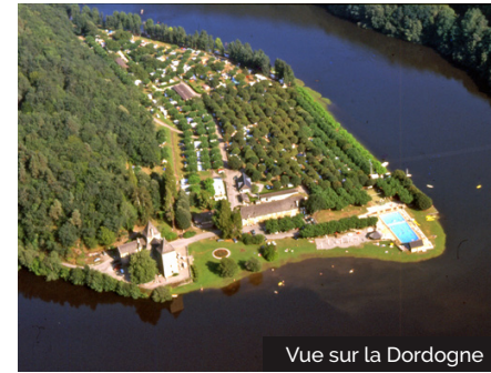
Vue sur la Dordogne