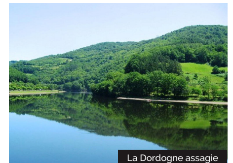
La Dordogne assagie

Le château du Gibanel se dresse aujourd'hui en bas des collines, au confluent du Doustre et de la Dordogne. rebâtie au XVII e siècle. Il comporte un corps de logis dont le toit est muni de lucarnes, flanqué de deux tours carrées couvertes de toits à pans. La première forteresse du XII e siècle, dominait jadis les gorges des 2 rivières. Il gardait autrefois le passage de la rivière. Les gabarriers à sa vue se préparaient à passer, non sans périls, le Malpas du Gibanel. Le mauvais pas, passage difficile sur la rivière qui n'existe plus suite à l'aménagement des barrages.