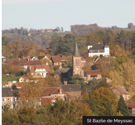
St Bazile de Meyssac

Située au pied d'un versant ensoleillé autrefois tout planté de vignes, mais aujourd'hui en prés verdoyants. Ses verts pâturages, ses vignes donnant encore un vin très fruité et apprécié, ses plantations de noyers qui produisent de savoureux fruits, en font un lieu riche et varié. Du sommet de la colline, un large panorama s'ouvre sur le Lot et la Vallée de la Dordogne tout proche et offre une vue sur l'ensemble de la commune.