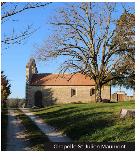
Chapelle St Julien Maumont