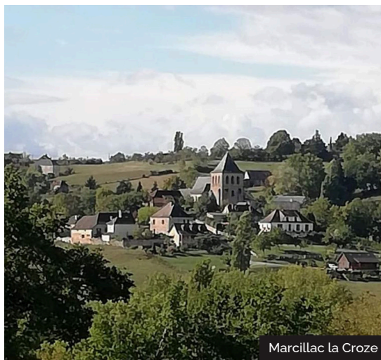
Marcillac la Croze

S'étendant sur la rive droite de la Sourdoire, Marcillac la Croze est en grande partie construite en «brasier», un beau grès dont les reflets blonds prennent des saveurs différentes à chaque heure du soleil. Si le château-fort a aujourd'hui disparu, le promeneur attentif pourra découvrir, ça et là, quelques vestiges et des belles demeures telle que le château de la Brousse ou de Livin.