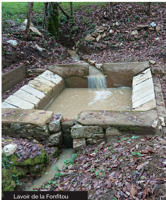
Lavoir de la Fonfitou

A Saint Michel de Bannières, l'eau, élément du patrimoine communal, est devenue le fil conducteur d'un chemin de randonnée. Partout présente, tantôt perçue comme menaçante, inquiétante mais aussi bienfaisante et précieuse, elle est évoquée en 1789 dans les cahiers de doléances (Révolution). Les paysans parlent de la multiplicité des sources et des ruisseaux, de la difficulté de cultiver les céréales à cause des nombreux jours de pluie et la présence de la «nielle» (maladie du blé). Au fil du temps il a fallu curer les fossés et les fontaines, canaliser l'eau pour assainir les terres de la prairie autrefois des marécages asséchés par les moines cisterciens d'Aubazine. Les villageois ont bâti un abreuvoir-lavoir, un puits dans la cour de la nouvelle école de garçons, une fontaine... Ils ont créé un syndicat de l'eau afin d'établir un réseau d'adduction d'eau potable dans un contexte politique et social mettant en pratique les théories de l'Hygiénisme. De nos jours, les marcheurs peuvent parcourir le territoire de la commune en allant d'un point d'eau à un autre. Ces éléments du petit patrimoine ont eu au fil du temps des utilisations différentes : abreuver les animaux, laver le linge, s'approvisionner en eau, arroser les terres... L'eau est une richesse, un enjeu, une nécessité, une ressource, un marqueur du paysage, un bien commun à tous, un élément du patrimoine communal qu'il faut apprendre à mieux connaître pour mieux le préserver.