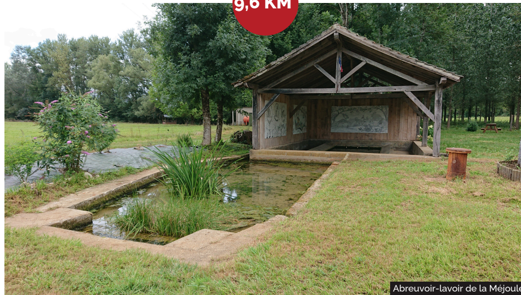
Abreuvoir-lavoir de la Méjoule