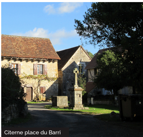
Citerne place du Barri