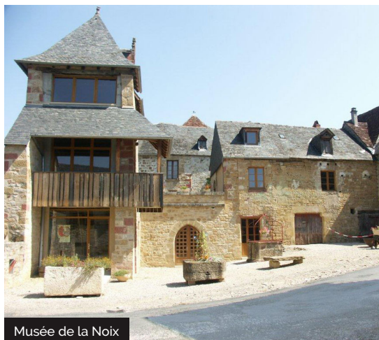
Musée de la Noix

Saillac est le berceau de la noix «Marbot». On la reconnaît grâce à son gros calibre, sous sa coquille tendre elle renferme un cerneau d'une extrême blancheur au croquant séducteur rappelant l'amande fraîche. La Noix Marbot est la plus précoce, sa récolte commence dès la mi-septembre. C'est la variété de prédilection pour la noix fraîche au goût fruité et doux, presque laiteux. Vendue fraîche et consommée telle quelle, c'est aussi une excellente noix de table une fois séchée. Elle est naturellement riche en fibres. Il est donc naturel de trouver ici, sur la route de la Noix du Périgord, un musée dédié à la noix : «Les Quatre Demoiselles, le Musée de la Noix où il y a à boire et à manger». Dans la belle salle voutée, par le son et l'image, la merveilleuse histoire de la noix vous est contée. Les salles suivantes conservent le mystérieux «trésor» où sont rassemblés œuvres et objets relatifs à la noix. Vérifiez les périodes d'ouverture avant votre venue au 05 55 22 70 62.