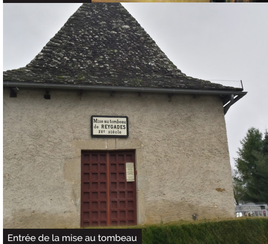
Entrée de la mise au tombeau

Embarquez vos randonnées en téléchargeant l'appli Vallée de la Dordogne - Tour .