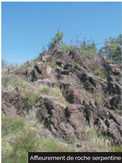
Affleurement de roche serpentine

Les sites de Bettu, Reygades et Cauzenille sont classés Natura 2000, zone de 3 affleurements rocheux de serpentines de part et d'autre de la vallée de la Dordogne. Les affleurements serpentiniques sont isolés et rares. Les pelouses et landes qui s'y développent forment des écosystèmes originaux, faits d'une flore et de groupements de plantes rare. Traditionnellement pâturés par les ovins, ces milieux fragiles, rocailleux et escarpés, délaissés par les activités agricoles, se referment avec le développement d'arbustes et d'arbres. Seul un peu de pâturage bovin se maintient sur les prairies moins escarpées. Le bûcheronnage, le débroussaillage, les fauches sont nécessaires à la restauration de ces milieux naturels.