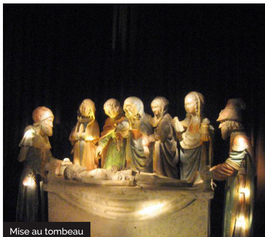
Mise au tombeau

La chapelle de l'ancien cimetière abrite une belle mise au tombeau datant du XV ème siècle (classée au Monuments Historiques), valorisée par un son et lumière qui exalte la troublante beauté d'une œuvre vivante. Le jeu des lumières souligne l'expression des visages et les gestes des acteurs du «Mystère». Le texte est lu par Jean Piat sur une musiquedu compositeur Jack Labrunie. Restaurée vers 1960, cette scène présente Nicodème et Joseph d' Arimathie tenant l'extrémité du linceul du Christ. Une des femmes et St Jean soutenant la Vierge. Une autre joint les mains, la dernière tient dans la main gauche le vase d'aromates. On note l'attitude sereine de la Vierge et des autres personnages, la beauté des visages et le drapé des vêtements souligné par une polychromie discrète. Le spectacle se déclenche lors de l' introduction des 3 pièces de 2€, quel que soit le nombre de personnes présentes.