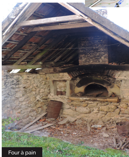
Four à pain