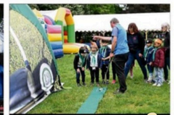
GOLE À l'issue de leur club, les enfants tentent de faire rouler leur balle sur le ballon... dans le titre.