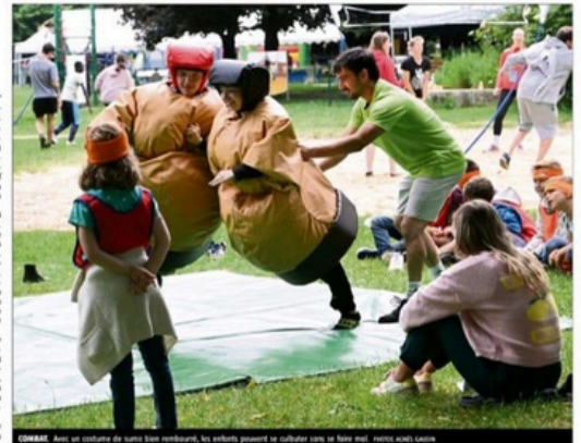
COMBAT Avec un costume de lutte bien rembourré, les efforts peuvent se cultiver sans se faire mal. resto-école Lucien

Séminet Party Trente jours. Cinquante activités en tous genres, organisées entre le parc de l'Auzelou, la salle de l'Auzelou et le stade Alexandre-Cueille. Organisées par le Comité départemental olympique et sportif (Cdos), la Flamme du cœur a pour but de faire découvrir des sports au grand public. Hier, le météo n'a pas voulu sonner. Mais peu importe. Entre deux averses, on s'amuse quand même. Sur le stade, les activités font et regrettent attendre. Mais les disciplines moins connues n'ont rien à leur envier. Dans un coin, quelques apprentis arbitres tentent de viser dans le mille. À l'appel, quelques gamins s'essayent à la pelote basque sur un mat érigé pour l'occasion. En contenance, à côté de la salle de l'Auzelou, des enfants découvrent le basket fauteuil. « C'est trop dur ! », entend-on. Quelques pas plus loin, dans le parc, les cris de joie, et les structures gonflables de toutes les couleurs attirent le grand public de tous âges. Chers à tous, l'événement se poursuit aujourd'hui de 9 h 30 à 16 heures. ■