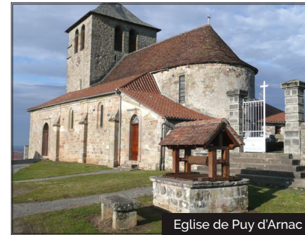
Eglise de Puy d'Arnac

Ce village est bâti sur un éperon rocheux dominant la plaine, dès l'Antiquité on y trouve un important castrum. Durant la 2 de Guerre Mondiale c'est un lieu stratégique de l'état major militaire. Puis c'était ensuite un pays viticole. Les vignes, détruites par le phylloxera, ont été remplacées par des fraises. C'est ici que se trouve le Centre Interrégional de Recherche et d'Expérimentation de la Fraise. Aujourd'hui la commune rurale est dotée d'espaces bocagers avec des élevages divers : vaches, oies, ovins, canards. Mais aussi la culture de noyers, noisetiers et châtaigniers ainsi que du maraîchage, de la vigne et des plantes aromatiques grâce aux producteurs locaux.