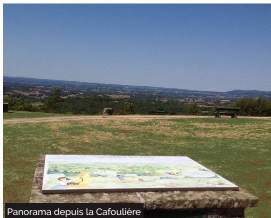
Panorama depuis la Cafoulière

Le plateau de La Cafoulière, à 350m d'altitude, posé sur la 1ère butte calcaire avant le causse du Quercy et adossé aux plateaux granitiques limousins, déploie un panorama à 360° avec un paysage magnifique de vallons et de collines. Les matins, plein sud, la brume dessine les contours de la Vallée de la Dordogne et fait émerger les châteaux de Curemonte. A l'ouest, ce sont les reliefs plus accidentés de la faille de Meyssac et au loin le château de Turenne. Quand vient le soir, des couchers de soleil uniques et somptueux embrasent l'horizon. Le site de La Cafoulière est un espace aménagé offrant aire de pique-nique, toilettes et jeux pour enfant tout en profitant de tables d'interprétations pour découvrir l'histoire, l'archéologie, la faune, la flore et la géologie qui entourent ce site de la Vallée de la Dordogne.