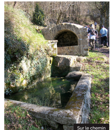
Sur le chemin

5 Au carrefour dans le village ( vue ), s'engager derrière le restaurant sur la petite route qui monte vers l'église de Puy-d'Arnac pour rejoindre le départ.