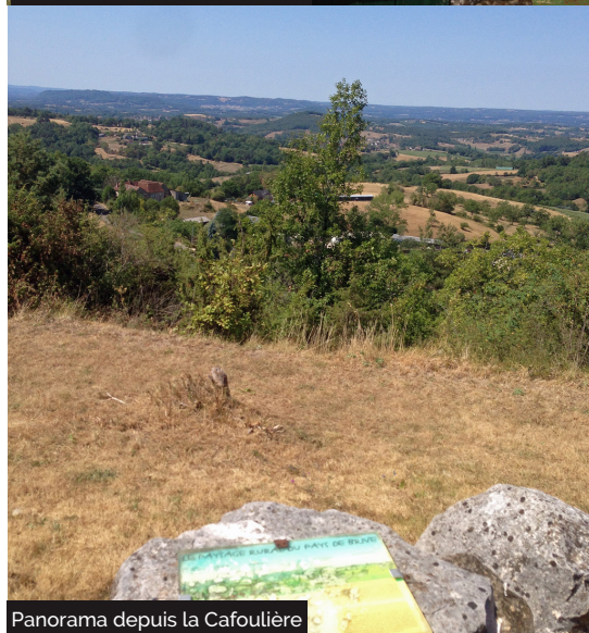
Panorama depuis la Cafoulière

Embarquez vos randonnées en téléchargeant l'appli Vallée de la Dordogne - Tour .