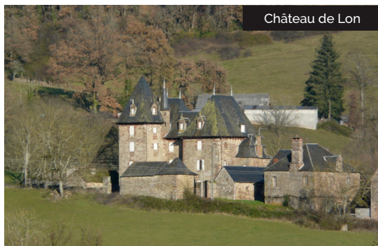
Château de Lon