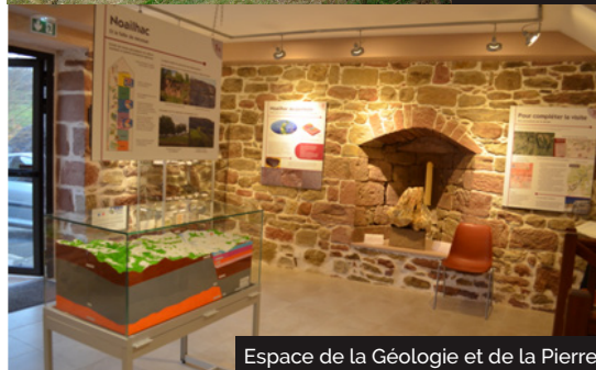
Espace de la Géologie et de la Pierre