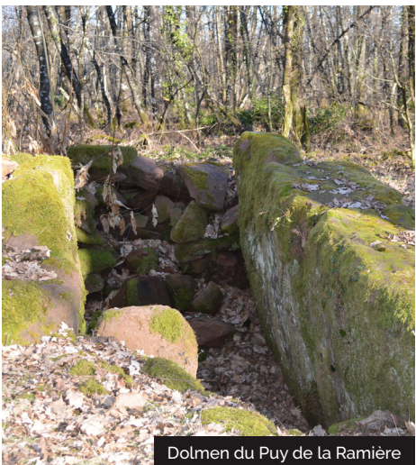
Dolmen du Puy de la Ramière