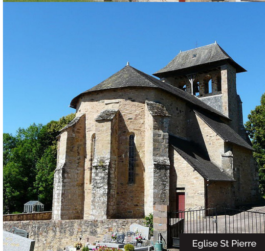
Eglise St Pierre

Embarquez vos randonnées en téléchargeant l'appli Vallée de la Dordogne - Tour.