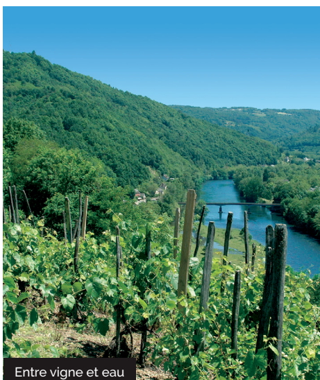
Entre vigne et eau