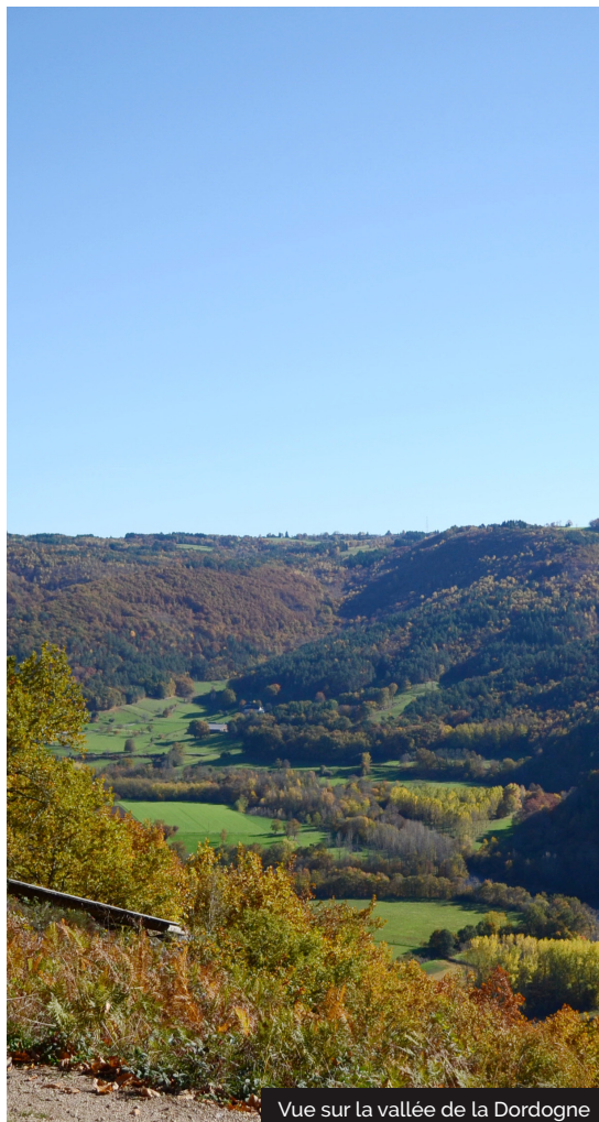
Vue sur la vallée de la Dordogne