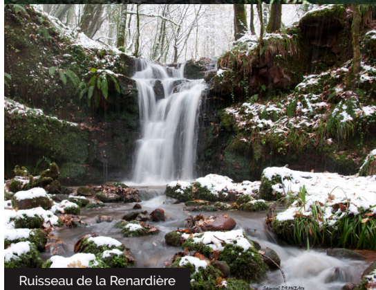
Ruisseau de la Renardière

Embarquez vos randonnées en téléchargeant l'appli Vallée de la Dordogne - Tour