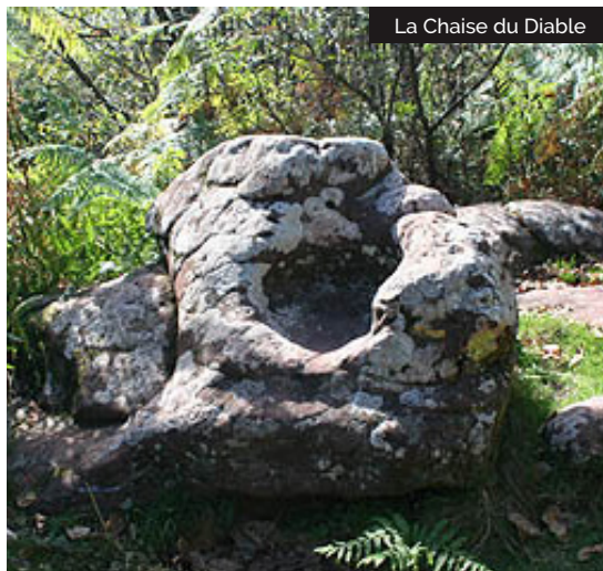
La Chaise du Diable