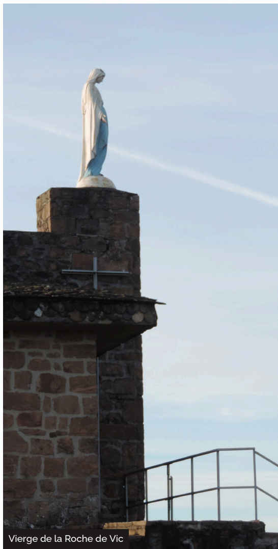
Vierge de la Roche de Vic

Situé à proximité des Quatre Routes d'Albussac, en direction de Beaulieu-sur-Dordogne, cet escarpement rocheux domine le paysage à 636m d'altitude. Il s'agit vraisemblablement d'un ancien oppidum gaulois qui était jadis entouré d'une enceinte ovale formée de murs ou de roches naturelles dont le diamètre atteignait 115m... Les anciens fossés sont aujourd'hui recouverts de bruyères. La légende veut que Roland, neveu de Charlemagne ait lancé son épée, la Durandal, depuis le sommet jusqu'à Rocamadour... Depuis 1880, Roche de vic est consacrée à la Vierge. La chapelle érigée en son honneur, est encore surmontée d'une statue de Sainte Marie. Chaque année, au 15 août, un pèlerinage rassemble des centaines de personnes. La table d'orientation permet de jouir d'un large panorama sur 360 degrés.