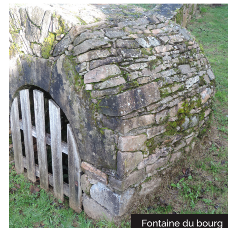
Fontaine du bourg

10 Tourner sur la route à gauche, ensuite à droite sur le chemin. Passer sur le ruisseau du Gô. Remonter ce chemin, ensuite la route de droite, puis une nouvelle fois à droite, et enfin à gauche juste avant les containers, rue de l'Eglise. Revenir à votre point de départ, face à l'église et au cimetière.