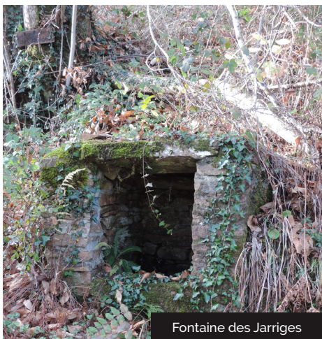
Fontaine des Jarriges