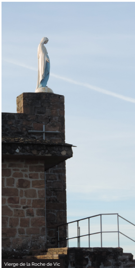
Vierge de la Roche de Vic

Sur la D940, à proximité des Quatre Routes d'Albussac, en direction de Beaulieu-sur-Dordogne. Cet escarpement rocheux domine le paysage à 636m d'altitude. Il s'agit vraisemblablement d'un ancien oppidum gaulois qui était jadis entouré d'une enceinte ovale formée de murs ou de roches naturelles dont le diamètre atteignait 115m... Les anciens fossés sont aujourd'hui recouverts de bruyères. La légende veut que Roland, neveu de Charlemagne ait lancé son épée, la Durandal, depuis le sommet jusqu'à Rocamadour... Depuis 1880, Roche de vic est consacrée à la Vierge. La chapelle érigée à son faite, est encore surmontée d'une statue de Sainte Marie. Chaque année, le 15 août, un pèlerinage rassemble des centaines de personnes. La table d'orientation permet de jouir d'un large panorama sur 360 degrés.