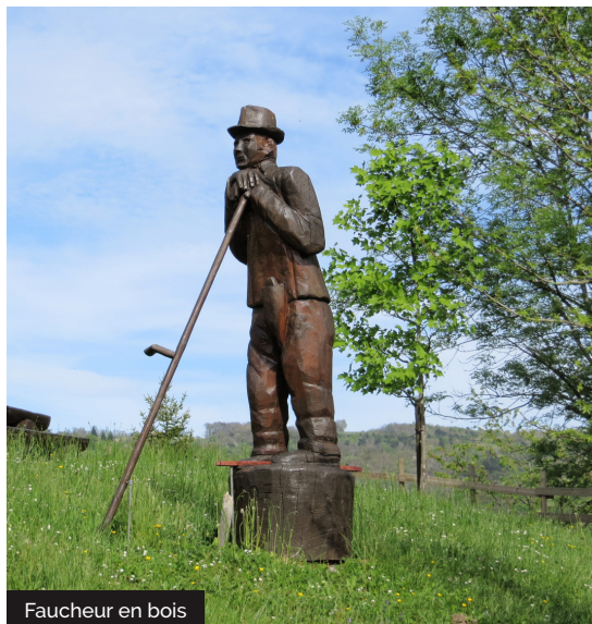
Faucheur en bois

Embarquez vos randonnées en téléchargeant l'appli Vallée de la Dordogne - Tour sur iPhone, l'iPad et l'iPod touch