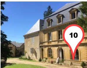
Le Château du Vigan