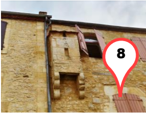
Le Rempart du fort