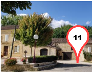
Le Presbytère et le Couvent