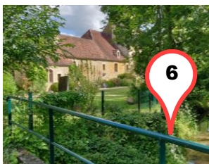
Le Manoir de la Barrière