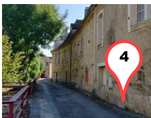
La rue de l'ancien Hôpital