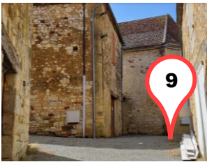
La Rue St Jean / Rue Bombe-cul