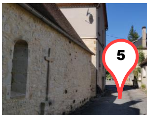
La Chapelle Sainte Rondine