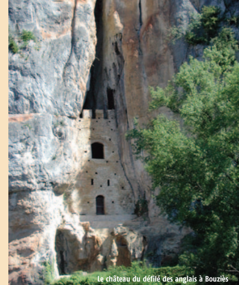
Le château du défilé des anglais à Bouziès

La dénomination "Châteaux des Anglais" ne correspond pas vraiment à la réalité historique. Il semblerait que ce soit la durée et les conséquences de la guerre de Cent Ans qui aient davantage marqué la tradition populaire.