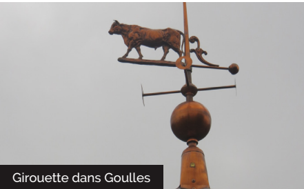
Girouette dans Goulles

Elle est formée de 8 chapelles avec un chœur ogival et contient des boiseries sculptées, des inscriptions murales et un bénitier monolithe. On observe les restes de l'ancienne construction notamment aux 2 extrémités, elle fut rebâtie au XVIIème (au dessus de la porte, date 1627). L'Église était en ruines depuis longtemps quand les habitants de la paroisse avec les archidiacres et le curé ont décidé de la faire réparer à leurs dépens. Elle possède à une des extrémités un cadran solaire, au-dessus d'un vitrail. Ont été restauré son intérieur et le clocher suite à la tempête de 1999.