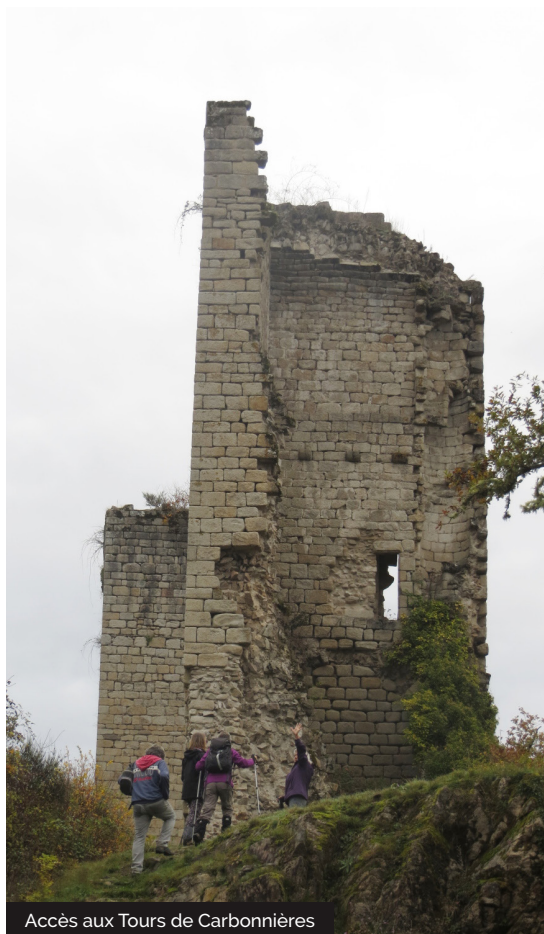
Accès aux Tours de Carbonnières

Érigées sur un promontoire rocheux au fond d'une étroite vallée entre les rivières de la Bedaine et de la Maronne. L'existence d'un castrum sur site remonte au premier âge féodal. A cette époque, des bâtiments étaient implantés sur l'éperon mais probablement des bâtiments en bois d'allure modeste (motte féodale). Les 2 tours carrées actuelles sont à une distance de 20m environ l'une de l'autre, bâties en gros blocs de granit soigneusement appareillés et régulièrement assisés, elles sont dénuées de tout contrefort et sont bien ancrées sur la roche affleurante. Deux familles distinctes occupées le rocher : les Carbonnières et les Montal. Au XV ème siècle, abandonnées, elles ne serviront plus que de refuge temporaire. La tour sud appelée la Bistorg (qui signifie en biais) était un passage obligé et avait donc une vocation défensive. La tour Nord, à vocation résidentielle, construite après 1359, a subi des remaniements pour accroître le confort de ses occupants.