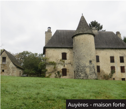
Auyères - maison forte