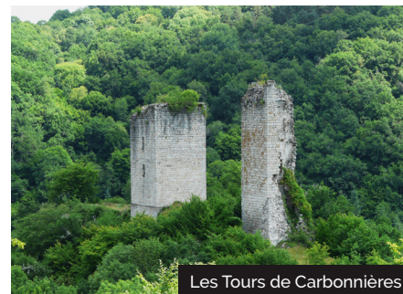
Les Tours de Carbonnières