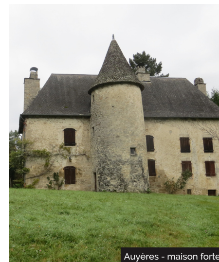
Auyères - maison forte