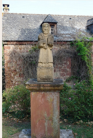
Saint Pierre de Noailhac

Blotti dans le vallon autour de son église, le village de Noailhac mérite bien que le randonneur s'y repose en visitant non seulement l'espace découverte de la Faille Géologique de Meyssac, mais aussi la magnifique église Saint Pierre es Liens dont la restauration a été récompensée en 2018 par les rubans du patrimoine. Intégrant les vestiges du château des Astorg et des Noailles détruit pendant les guerres de religion, elle surprend par sa tour de guet et par son intérieur riche et chargé d'histoire. Et quand vous aurez repris des forces, 6 kilomètres plus loin, ne manquez pas le tumulus long à dolmen décentré du Puy de la Ramière.