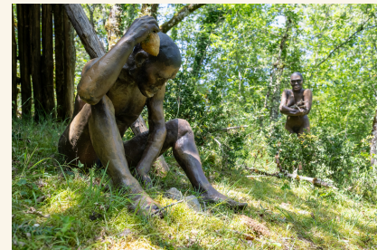
La Grotte des Carbonnières