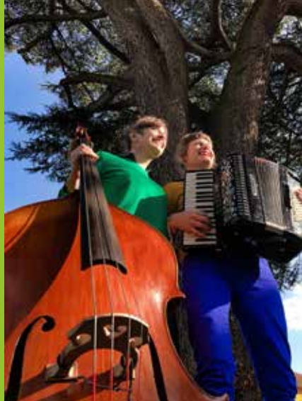
Chansons de femmes et d'arbres - CIE DIOD (©IG@ilyanyare)