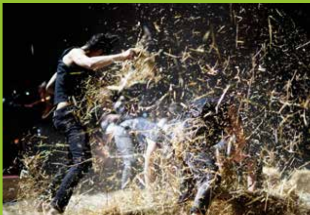
S.A.C.R.E - Cie Humanum