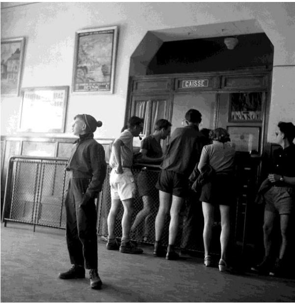
Visiteurs au Gouffre de Padirac (1954)