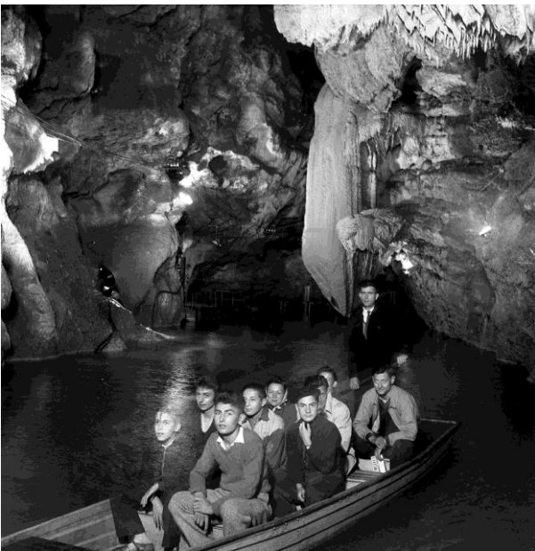
Photo rituelle au Lac de la Pluie (1954)