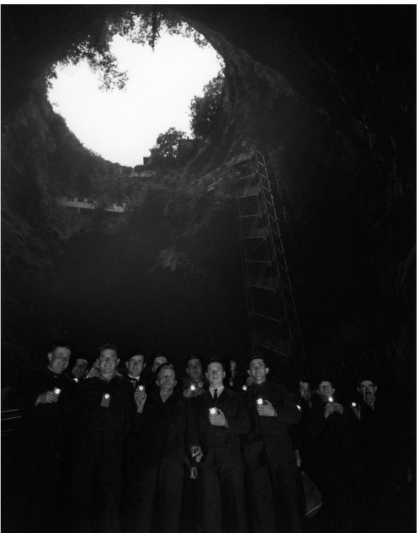
Les guides-bateliers du Gouffre de Padirac (1954)