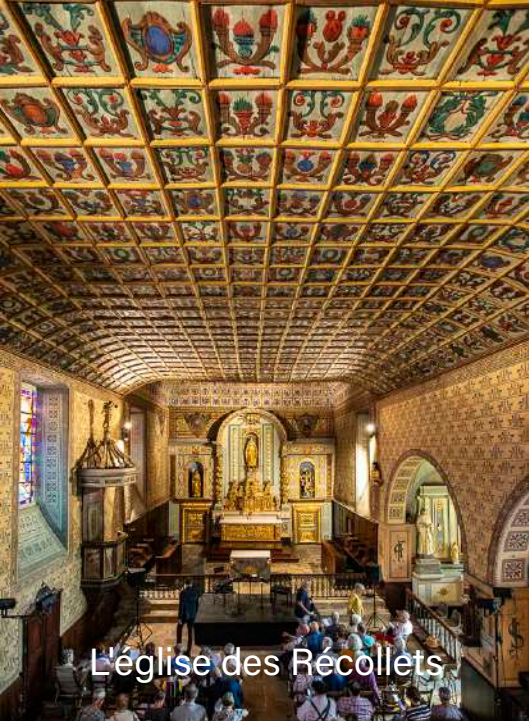
L'église des Récollets