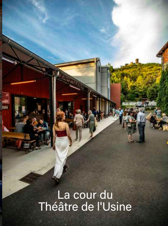
La cour du Théâtre de l'Usine