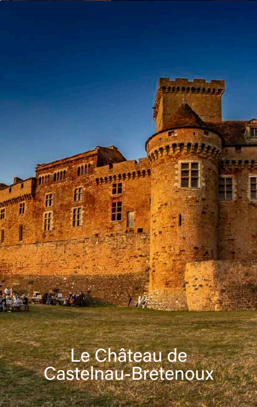
Le Château de Castelnau-Bretenoux