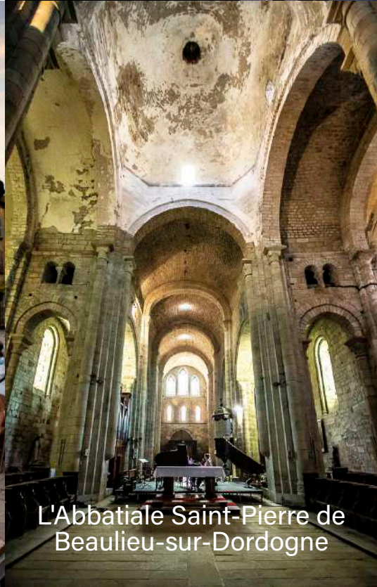
L'Abbatiale Saint-Pierre de Beaulieu-sur-Dordogne