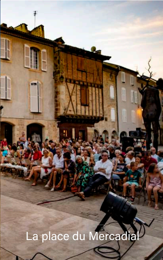
La place du Mercadial