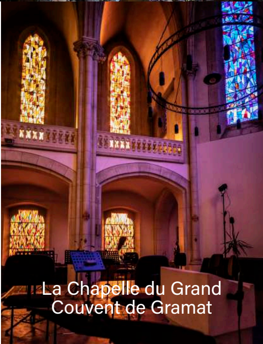
La Chapelle du Grand Couvent de Gramat

QUELQUES LIEUX EMBLÉMATIQUES