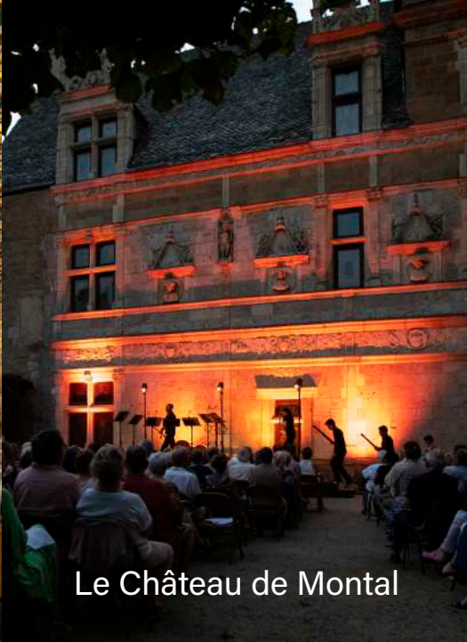
Le Château de Montal