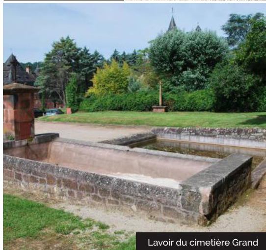
Lavoir du cimetière Grand

Embarquez vos randonnées en téléchargeant l'appli Vallée de la Dordogne - Tour .