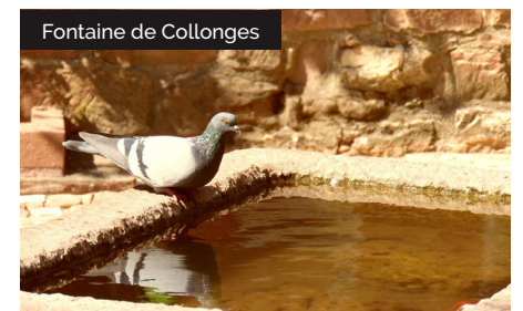
Fontaine de Collonges

8 Au croisement, prendre à gauche vers le lieu dit la Veyrie. Traverser-le. Au croisement prendre à droite. Sur votre gauche sur l'espace de verdure, le lavoire du cimetière Grand. Finir de monter la rue, passer devant le Castel de Maussac . A la D38, tourner à gauche pour rejoindre le point de départ.