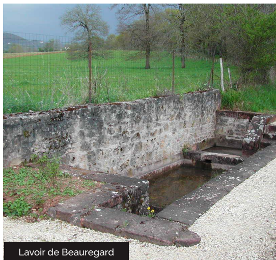
Lavoir de Beauregard

Le lavoir du cimetière grand en grès rouge et moellons équarris en plein ciel est au milieu d'un espace vert en bordure du bourg de Collonges, a deux bacs : le premier (à droite) servait à faire boire le bétail, puis l'eau coulait dans celui d'en dessous qui était le lavoir. Mais l'été venu, le lavoir disparaît une scène le recouvrant pour accueillir les fameuses représentations des Théâtrales de Collonges depuis plus de 30 ans.