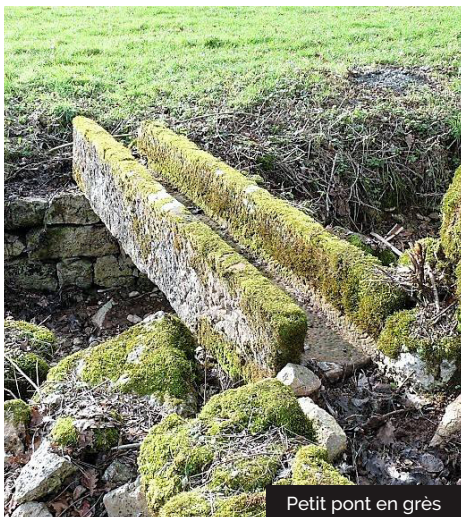
Petit pont en grès