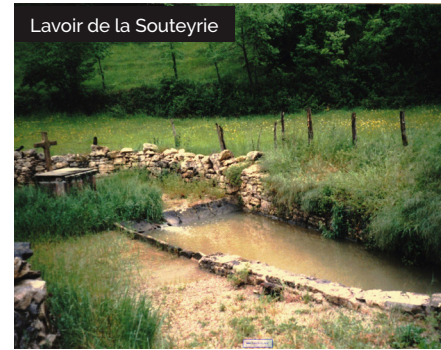
Lavoire de la Souteyrie

Situé sur des sols calcaires donc perméables, le village de Collonges a toujours manqué d'eau. L'eau était captée et acheminée depuis des sources en amont de Collonges jusqu'aux fontaines du village où les habitants venaient se ravitailler car il n'y avait pas d'eau courante jusqu'en 1955. Les lavoirs étaient un véritable lieu de vie sociale où l'on faisait sa lessive. En complément de ce parcours, découvrez le sentier des sources, 6km, qui conte l'histoire de l'eau avec des témoignages sur les péripéties des habitants grâce à l'application www.sentier-des-sources.fr , commenté par Pierre Bellemare.