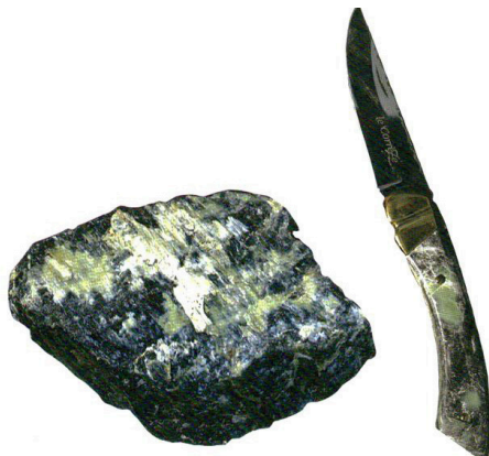
Serpentine : de l'état brute à l'objet artisanal

La pierre serpentine regroupe plus d'une vingtaine de minéraux du groupe des silicates. Ce n'est donc pas un minéral, mais un ensemble. Également appelée ophite ou ophiolite, la pierre serpentine est souvent difficile à identifier, car elle se décline dans de multiples couleurs et de nombreuses variétés : on la rencontre le plus souvent de teinte olive, mais elle existe aussi dans des nuances rouge, vert clair, vert forêt, jaune, noir ou blanc. Le mot serpentine provient de l'aspect le plus répandu de ce minéral, plutôt rugueux et écaillé avec une teinte vert olive qui rappelle la couleur du reptile. En latin, serpentine signifie d'ailleurs serpent de pierre, et son autre appellation, ophite, provient du grec ophidis qui désigne le serpent. La pierre serpentine est utilisée depuis la nuit des temps pour ses vertus décoratives et médicinales.