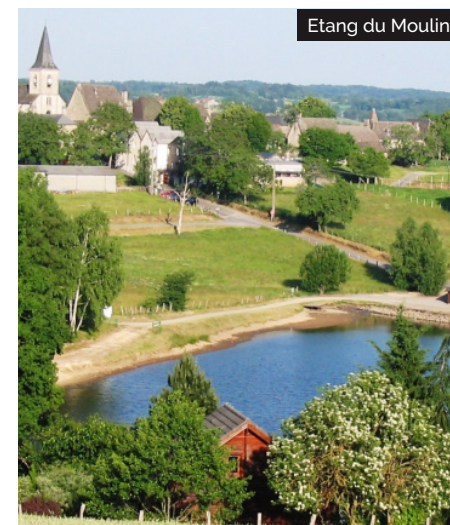
Etang du Moulin

13 À la station de pompage, tourner à gauche pour aller jusqu'à la tourbière . A la route, bifurquer à gauche puis immédiatement à droite sur le chemin forestier. De retour au point 3, remonter à gauche pour rejoindre la place de la Mairie.