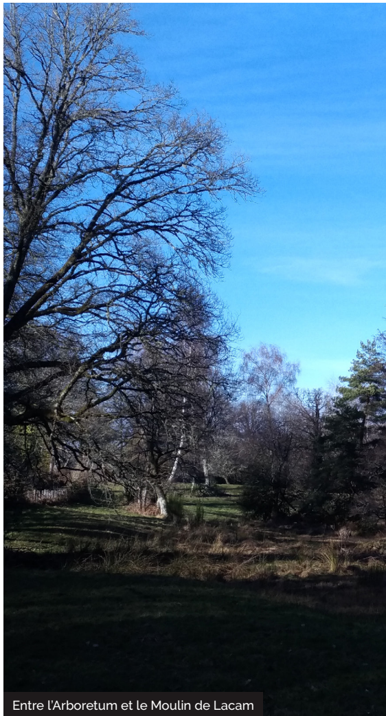
Entre l'Arboretum et le Moulin de Lacam

Embarquez vos randonnées en téléchargeant l'appli Vallée de la Dordogne - Tour sur iPhone, l'iPad et l'iPod touch