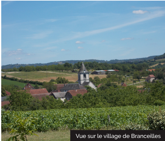
Vue sur le village de Branceilles