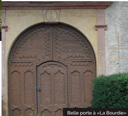
Belle porte à «La Bourdie»

Embarquez vos randonnées en téléchargeant l'appli Vallée de la Dordogne - Tour