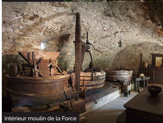
Intérieur moulin de la Force

Embarquez vos randonnées en téléchargeant l'appli Vallée de la Dordogne - Tour.