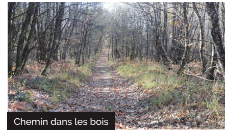
Chemin dans les bois