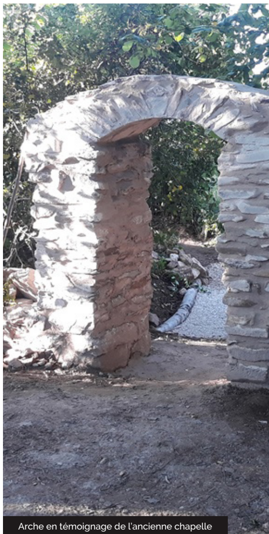
Arche en témoignage de l'ancienne chapelle