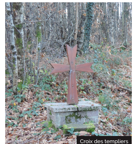
Croix des templiers

8 A gauche, prendre le long et droit chemin ramenant au point n°2. De là : retour en sens inverse au départ pour cela reprendre à droite sur la petite route pour retrouver le chemin à gauche et revenir au point de départ.