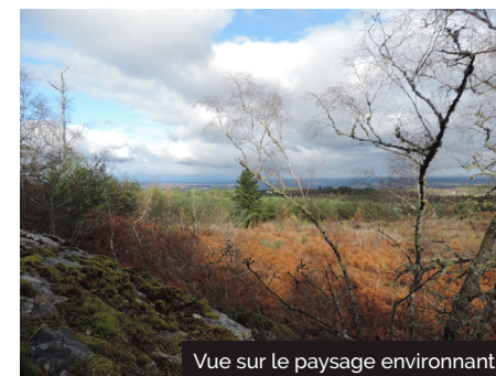
Vue sur le paysage environnant

Petit conseil : après votre balade visitez le joli bourg d'Auriac, profitez de son plan d'eau ou bien encore découvrez les Jardins de Sothys, jardin remarquable.