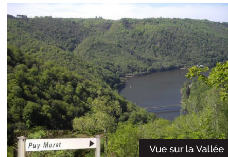
Vue sur la Vallée

Visiter ses charmantes ruelles, appelées corijoux, encadrées par d'impressionnantes maisons en granit blond, couvertes de lauzes qui grésillent au soleil. Au centre, son église massive surmontée de sa tour de garde. L'arche sauvée des eaux, vient de l'ancienne abbaye de Valette du XIII ème érigée au creux des gorges de la Dordogne. En 1947, le barrage du Chastang est construit en aval de l'abbaye et sa mise en eau en 1951 sera fatale à l'édifice qui sera noyé. Des maçons du pays, sauvent une partie de l'édifice en démontrant l'ancienne porte romane qu'ils installent ici.