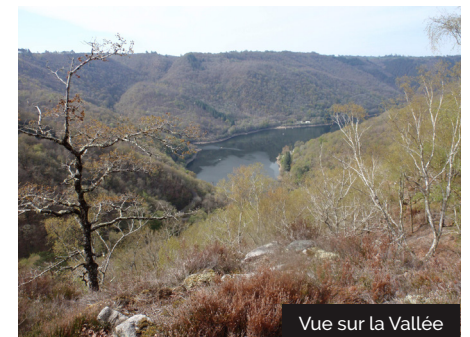
Vue sur la Vallée