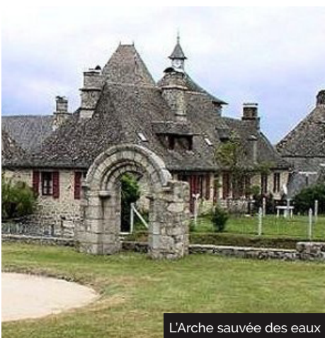
L'Arche sauvée des eaux