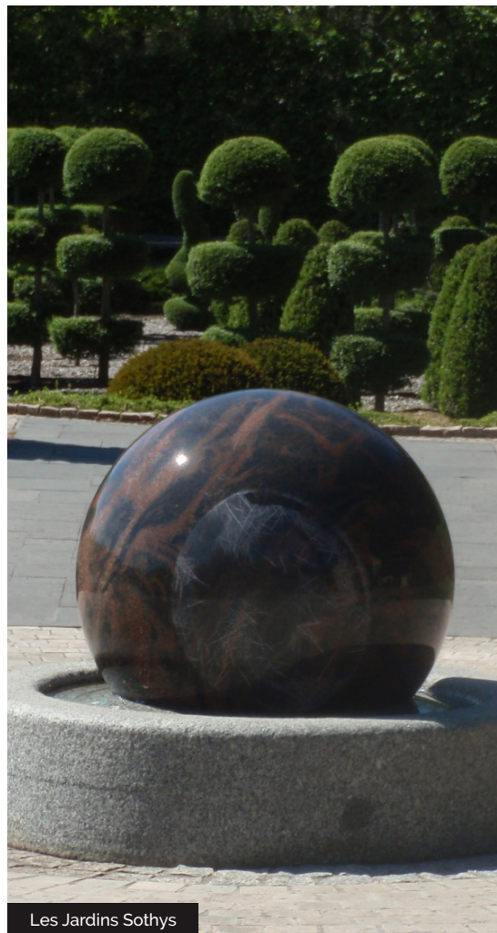
Les Jardins Sothys

Crée en 2007 sur 4 ha, au coeur d'un écrin végétal préservé et riche de sa diversité, sur les terres natales de la famille Mas fondateur de Sothys. La philosophie Sothys est vouée à la beauté, à la cosmétique et au bien-être. Les Jardins Sothys invitent au fil de ses escapades à découvrir une nature préservée associant beauté et esthétique. « Escapade » est le nom d'espace, d'univers intimiste offrant à chaque fois des lieux d'expression et d'interprétation de la nature : escapade velours, senteur, blanche, égyptienne, soleil, hydratante... Allant du jardin à la française aux jardins japonais en passant par la roseraie et la prairie humide. Les créateurs des jardins Sothys ne cessent de faire appel à leur imagination comme le thème de la peau, lien direct avec les produits cosmétiques. Couche protectrice comme l'écorce de l'arbre, la peau est sujette aux aléas du temps. Elle se desquame, se régénère... Une invitation au rêve, à la détente et à l'évasion.