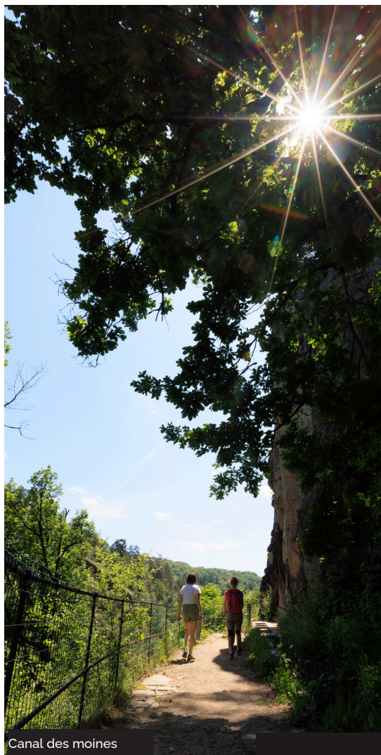
Canal des moines

Un ouvrage d'art unique... Milieu du XIII ème , un certain Etienne, ermite dans la forêt locale, fonde 2 monastères qui intègrent l'Ordre cistercien. Ces derniers, grands spécialistes de la maîtrise de l'eau, construisent un canal pour alimenter le vivier du monastère, irriguer prairies et jardins, actionner 3 moulins. Le canal des Moines est un ouvrage d'art et de technique exceptionnels, unique en Europe dans sa conception et sa hardiesse. Epousant les contours du versant rocheux et escarpé de la vallée du Coyroux, ce canal constitue un vrai défi et témoigne de l'audace des moines pour contourner les obstacles naturels et enjamber les précipices. Ainsi 1500m de canal avec une faible pente assure une alimentation minimale en eau, vitale au développement du monastère. Inscrit parmi les Monuments Historiques depuis 1966, entre 2006 et 2010 des travaux spectaculaires ont permis sa restauration pour rendre de nouveau le site visitable pour le plaisir de tous.