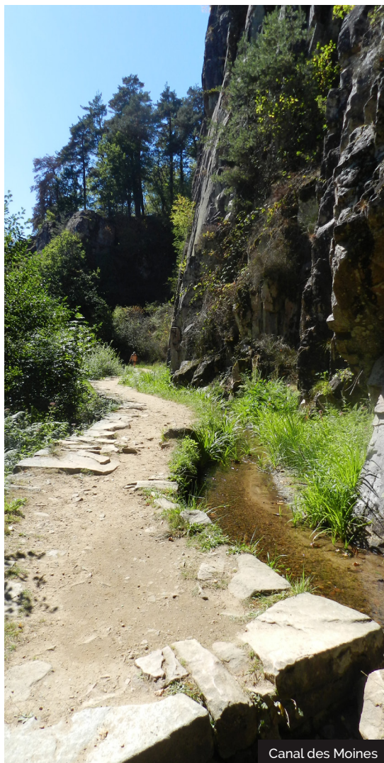
Canal des Moines

Un ouvrage d'art unique... Milieu du XIIème, un certain Etienne, ermite dans la forêt locale, fonde 2 monastères qui intègrent l'Ordre cistercien. Ces derniers, grands spécialistes de la maîtrise de l'eau, construisent un canal pour alimenter le vivier du monastère, irriguer prairies et jardins, actionner 3 moulins. Le canal des Moines est un ouvrage d'art et de technique exceptionnels, unique en Europe dans sa conception et sa hardiesse. Epousant les contours du versant rocheux et escarpé de la vallée du Coyroux, ce canal constitue un vrai défi et témoigne de l'audace des moines pour contourner les obstacles naturels et enjamber les précipices. Ainsi 1500m de canal avec une faible pente assure une alimentation minimale en eau, vitale au développement du monastère. Inscrit parmi les Monuments Historiques depuis 1966, entre 2006 et 2010 des travaux spectaculaires ont permis sa restauration pour rendre de nouveau le site visitable pour le plaisir de tous.