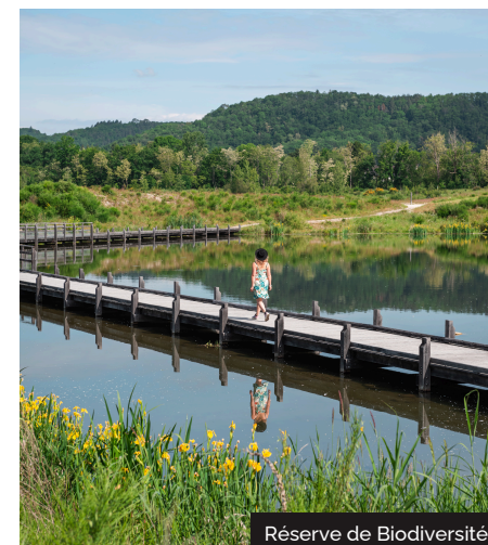
Réserve de Biodiversité

7- Au croisement, à gauche, direction Camping Municipal. Au bout du chemin à droite. Longer les sanitaires du camping jusqu'à voir le stade puis tourner à gauche, passer un portail, Aller à droite à l'arrière de la piscine. Suivre la Dordogne en empruntant le chemin des gabariers et rejoindre les quais d'Argentat ( vue sur la berge opposée ).