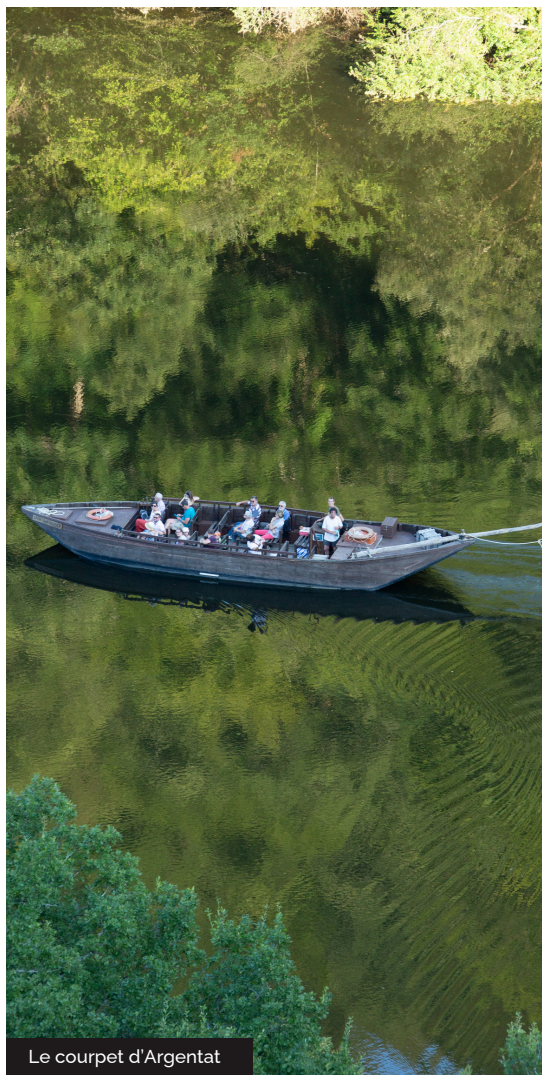
Le courpet d'Argentat

Aujourd'hui classée réserve mondiale de biosphère par l'UNESCO, la rivière Dordogne était autrefois une voie commerciale importante. Les gabares, longues barques à fond plat, dont le nom varie selon la longueur (courpet, gabarot...) assuraient le trafic de bois, fromage, châtaigne, tannerie... Depuis Spontour jusqu'à Libourne, voire Bordeaux, transportant 10 à 20 tonnes de marchandises sur des eaux capricieuses. La navigation n'était possible que par hautes eaux, et il fallait fabriquer en moyenne 400 gabares par an car à l'arrivée elles étaient démontées pour leur bois. Les gabariers remontaient alors la Dordogne par voie terrestre emportant souvent avec eux le précieux sel. Etre gabarier c'était une vie de périples au fil de l'eau et de ses dangers, sans parler du Coulobre serpent légendaire emportant les bateliers... Vivez leurs aventures lors d'une visite guidée en gabare en amont du barrage du Sablier (réservation à l'Office de Tourisme).