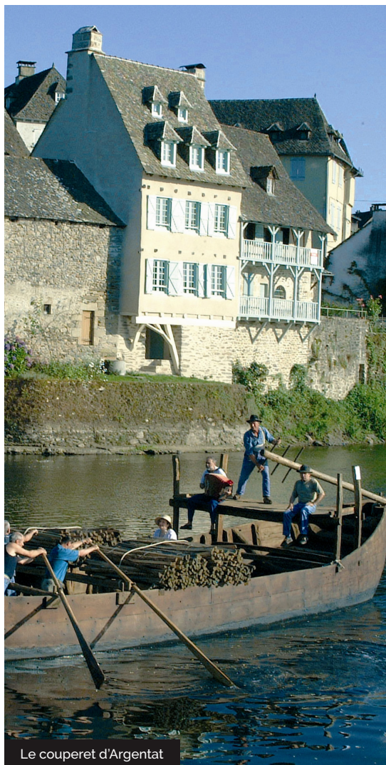
Le couperet d'Argentat