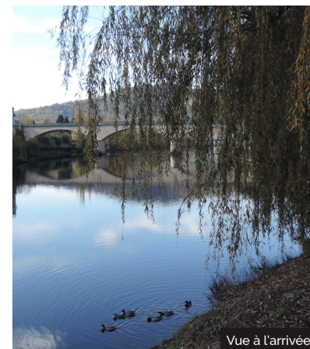
Vue à l'arrivée

7 Au croisement, à gauche, direction Camping Municipal. Au bout du chemin à droite. Longer les sanitaires du camping jusqu'à voir le stade puis tourner à gauche, passer un portail. Aller à droite à l'arrière de la piscine. Suivre la Dordogne en empruntant le chemin des gabariers et rejoindre les quais d'Argentat ( vue sur la berge opposée ). Table de pique nique à l'ombre d'un saule pleureur près des quais.