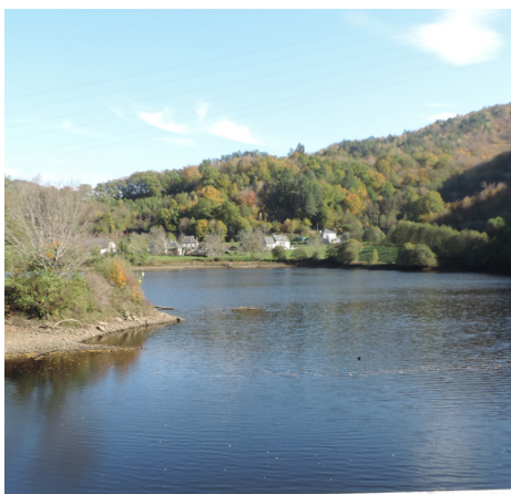
Retenue du barrage du Sablier