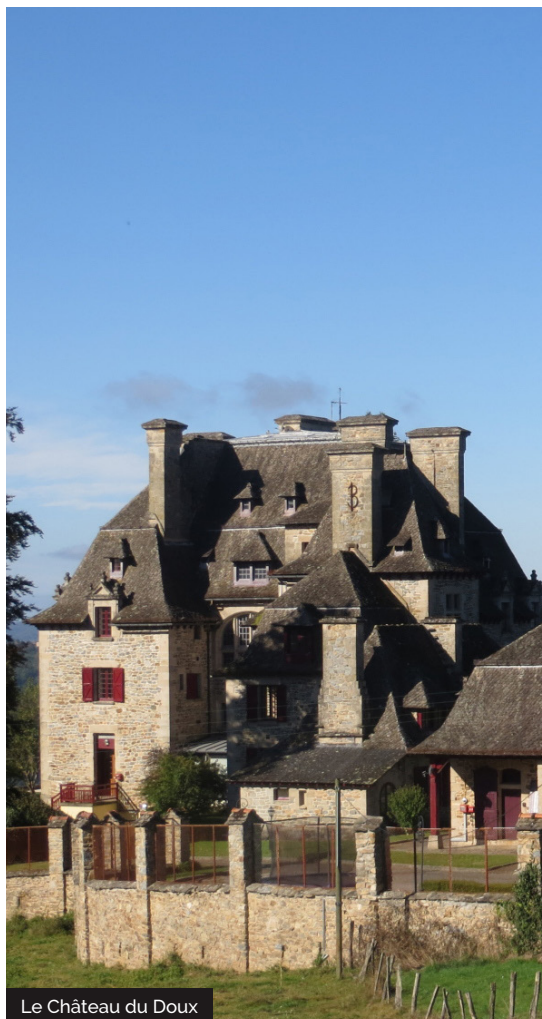
Le Château du Doux