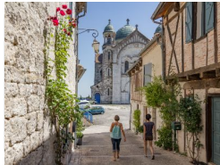
0.7km – Castelnau-Montratrier