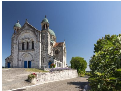
0.7km – Église Saint-Martin