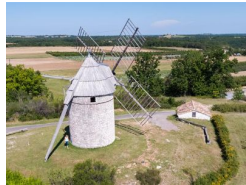
9.5km – Moulin de Boisse