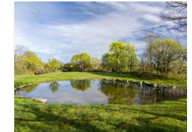
15.2km – Lac et lavoirs de l'Escalier