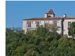
9.5km – Château de Cieurac