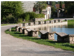
16.8km – Lavoir-Papillon d'Aujols