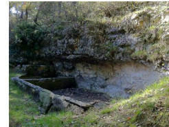
6.9km – La fontaine de la Rouquette