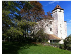
5.9km – Château de Pauliac à Cieurac