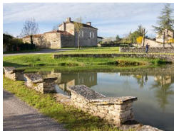
16.8km – Lavoirs papillons