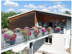
0.2km – Office de Tourisme Cahors Vallée du Lot - Bureau d'information