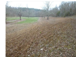
29.4km – La truffière de Bournel