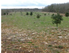
4.7km – La truffière des Ginestes