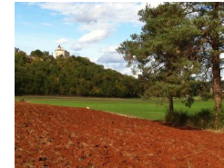
7.6km – La combe et le château de Cieurac