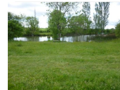
23.4km – Lac du Fraysse