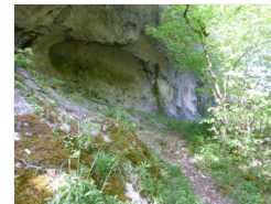
19.3km – Grotte des Conquettes