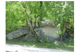
30.6km – Dolmen de Peyrelevalde