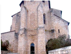
0.3km – Lalbenque