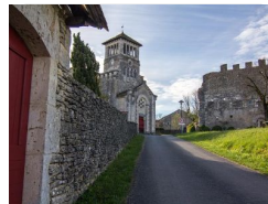
17.2km – Eglise et vestiges du château