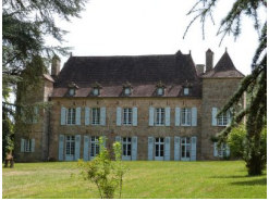
26.4km – Château de la Rauze