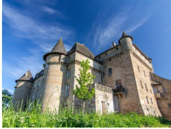
28.8km – Château de Lacapelle-Marival