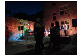
17.5km – Théâtre de Verdure