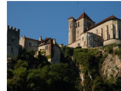
17.2km – Vue en contre bas de Saint-Cirq-Lapopie