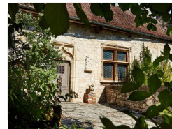
17.4km – Maison Rignaut