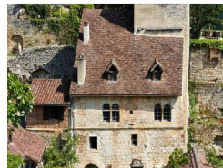
17.4km – Maison Breton