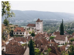
17.4km – Eglise et Chapelle