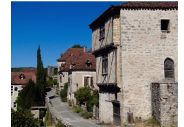
17.3km – Maison Bordes