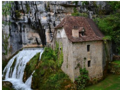
0.2km – Moulin de la Pescalerie