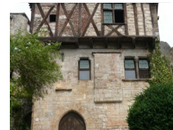
17.5km – Maison Vanoy