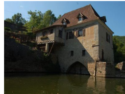
16.9km – Moulin d'Aulanac