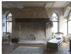
17.4km – Maison Daura