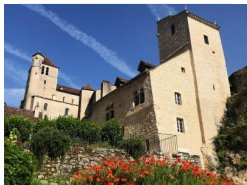
17.4km – Centre international du surréalisme et de la citoyenneté