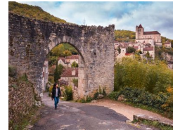
17.2km – Porte de Rocamadour