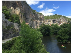
0.4km – Château des Anglais et maisons troglodytes de Cabrerets