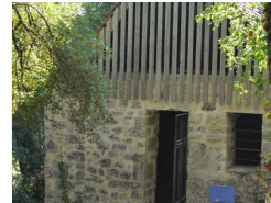
17.1km – Chapelle des mariners