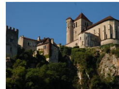
17.5km – Eglise de Saint-Cirq Lapopie