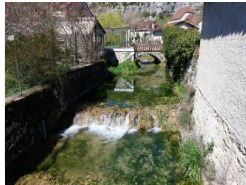
0.2km – Lavoir de la Sagne