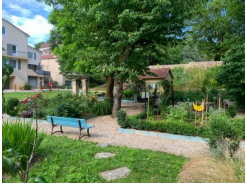
0.2km – Jardin des Murs-Murs