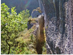
0.5km – Aqueduc romain de Divona