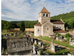
1.2km – Église Notre Dame de Velles