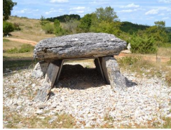
24.8km – Dolmen du Pech Laglaire