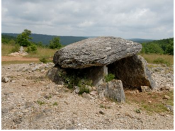
0km – Gréalou