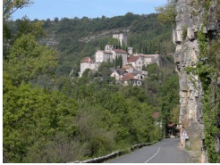
14.1km – Montbrun