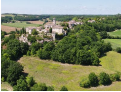
22.2km – Flagnac