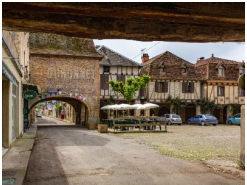
22km – Bretenoux