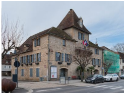
22km – Porte de la Guierle, Bretenoux